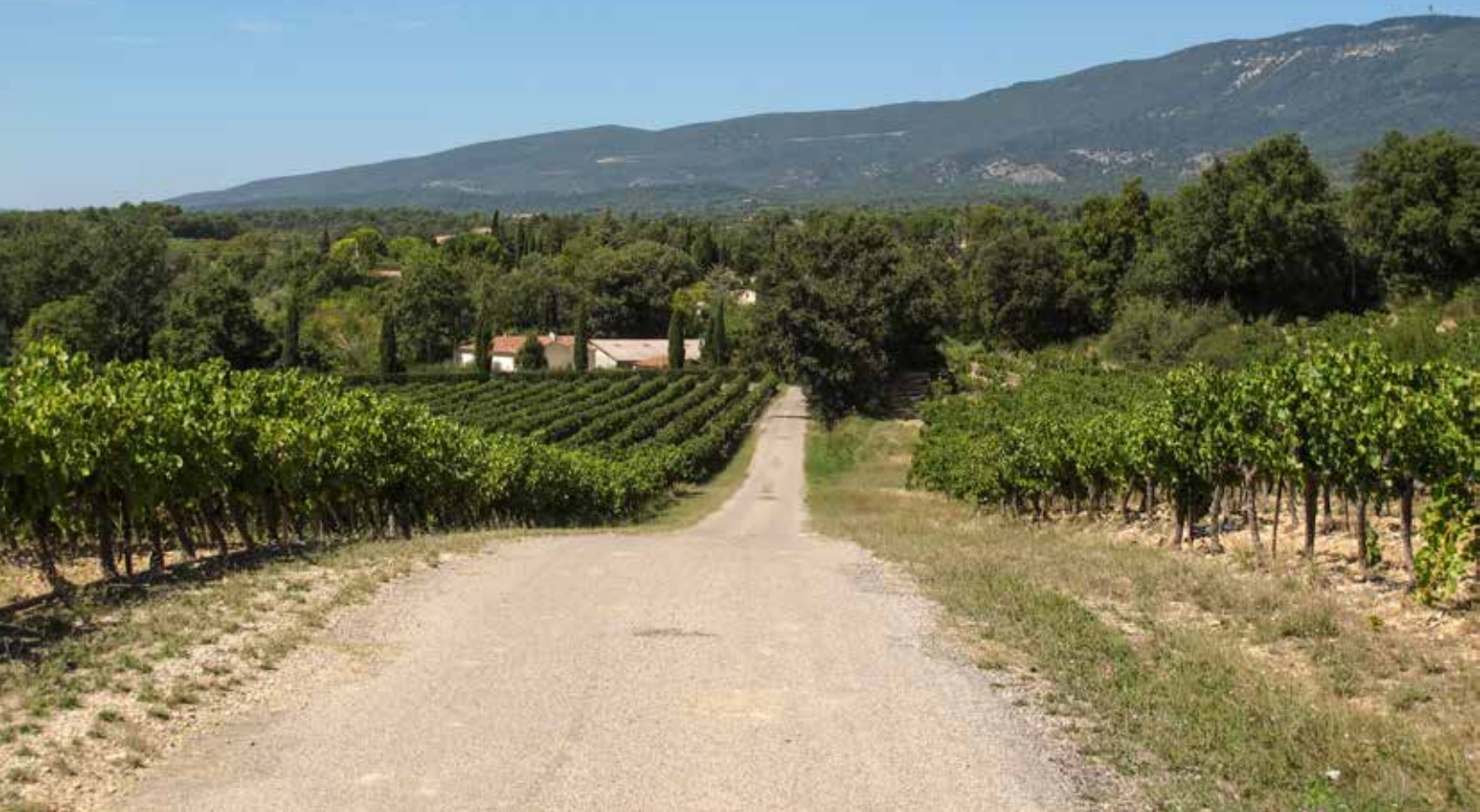
Dwars door de wijngaarden met het Luberonmassief op de achtergrond.