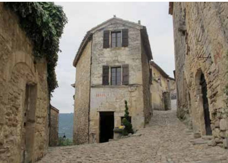
De nauwe straatjes van Lacoste.