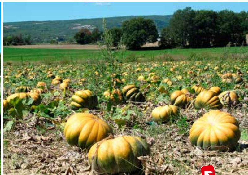
Groot, groter, grootst, ook onder de pompoenen.