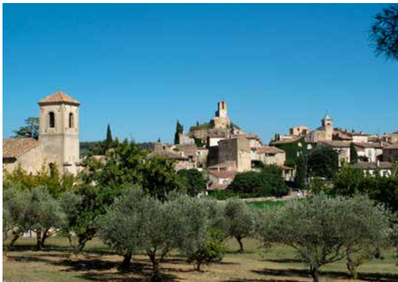
De drie kerktorens van Lourmarin.

Volx rijd ik via een brug over het EDF-kanaal (Electricité de France). Het is afgeleid van de natuurlijke loop van de rivier en doet dienst als drinkwater, als irrigatie voor de landbouw en uiteraard als aandrijving van elektriciteitsturbines.