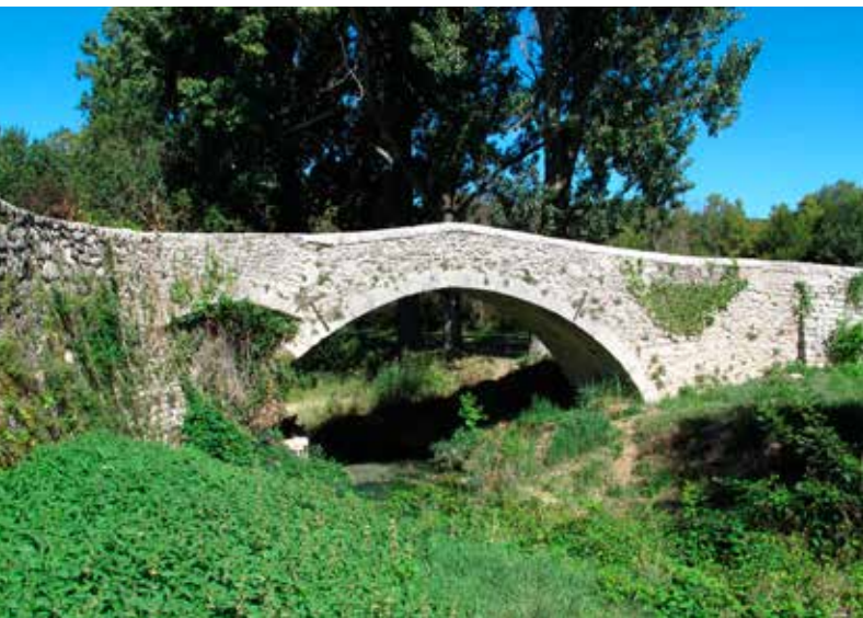
Oude Romeinse brug over de Aiguebelle.