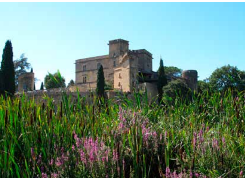
Het kasteel van Lourmarin.