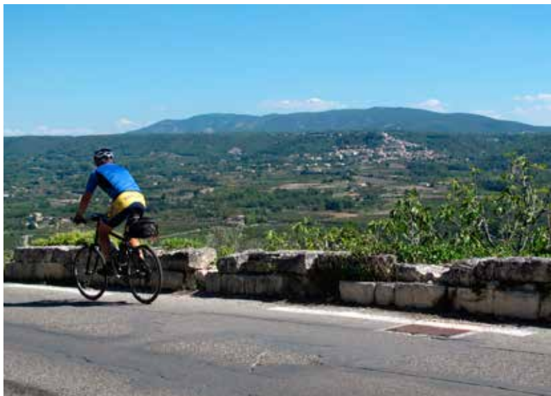
Panorama op Bonnieux.