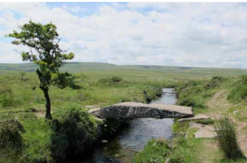
Een oude 'clapper bridge' in Dartmoor.