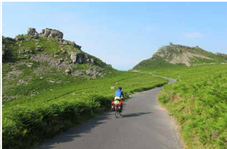
Door de Valley of Rocks vlakbij Lynton.