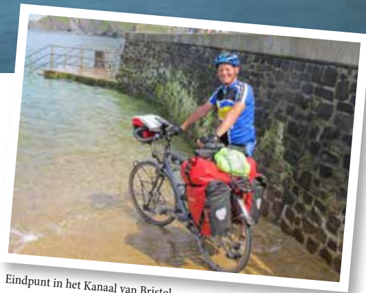
Eindpunt in het Kanaal van Bristol.