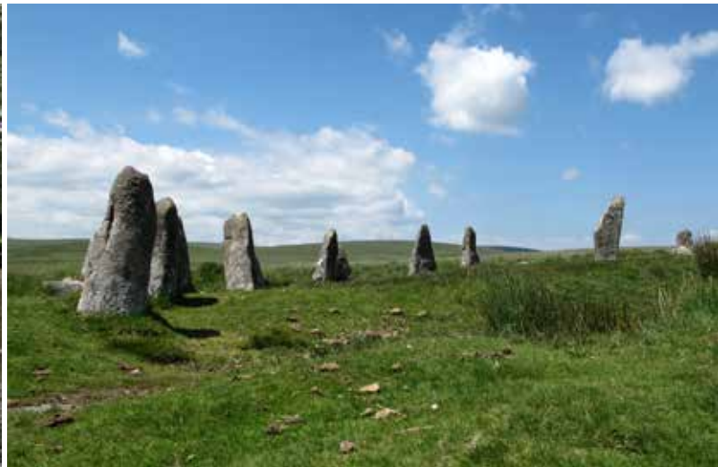
Een steencirkel in Dartmoor National Park.