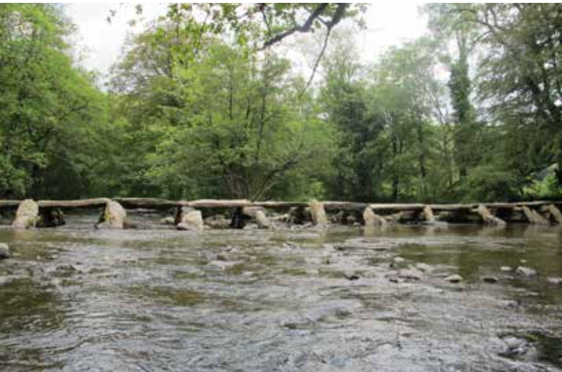
Tarr Steps, een bekende 'clapper bridge' in Exmoor.