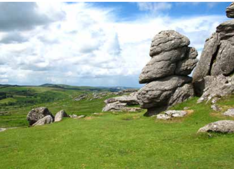
Dartmoor National Park op zijn best.